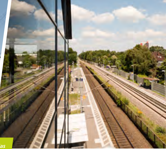
Der Bahnhof mit Einkaufszentrum (li./re.) und das Rathaus von Tornesch (unten)