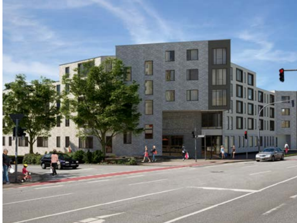
Die neue Eckbebauung: Im Erdgeschoss sind der Empfang, der Pflegestützpunkt des DRK, ein Kiosk sowie ein Nachbarschaftstreff vorgesehen.

an Betreuungs- und Pflegeleistungen, die mit der Kranken- bzw. mit der Pflegekasse abgerechnet werden können.