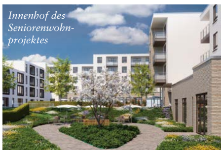
Innenhof des Seniorenwohnprojektes

Mitglieder wurden bereits Lösungen gefunden. So wird parallel zu dem Seniorenwohnprojekt ein weiteres Wohnhaus im Alten Kirchenweg errichtet. Die 25 Wohnungen sind vorrangig für ADLERSHORST-Mitglieder aus den zum Rückbau bestimmten Gebäuden vorgesehen.