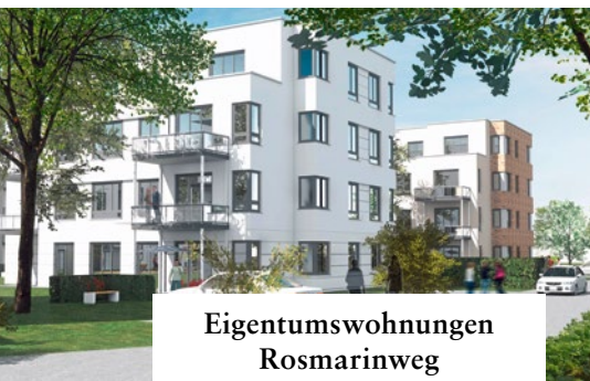
Eigentumswohnungen Rosmarinweg Musterwohnung eingerichtet

Neubau, Modernisierung und Instandhaltung – unser Programm für 2016 ist so umfangreich, dass wir Ihnen hier nur eine Auswahl aus unserem Bauprogramm vorstellen können. Über weitere Planungen halten wir Sie über unser Internetportal auf dem Laufenden. Außerdem berichten wir ausführlich über unsere neuen Projekte in der nächsten Ausgabe des Journals HORST, das im Sommer erscheinen wird.